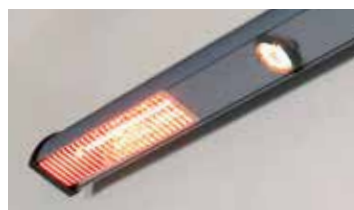
Éclairage & chauffage