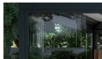
Parois vitrées coulissantes